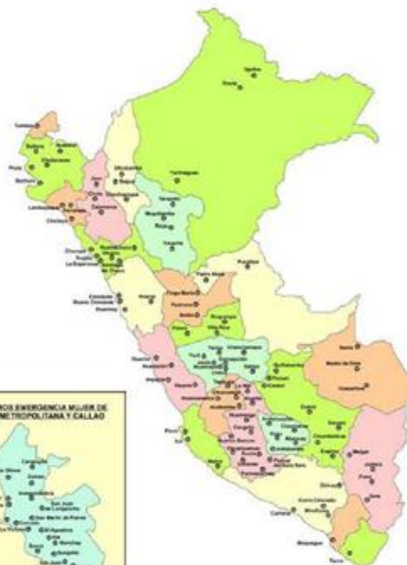
CENTROS EMERGENCIA MUJER A NIVEL NACIONAL