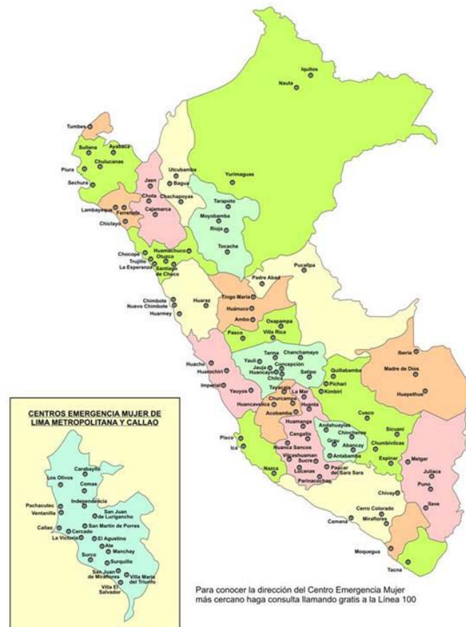
CENTROS EMERGENCIA MUJER A NIVEL NACIONAL

Para conocer la dirección del Centro Emergencia Mujer más cercano haga consulta llamando gratis a la Línea 100