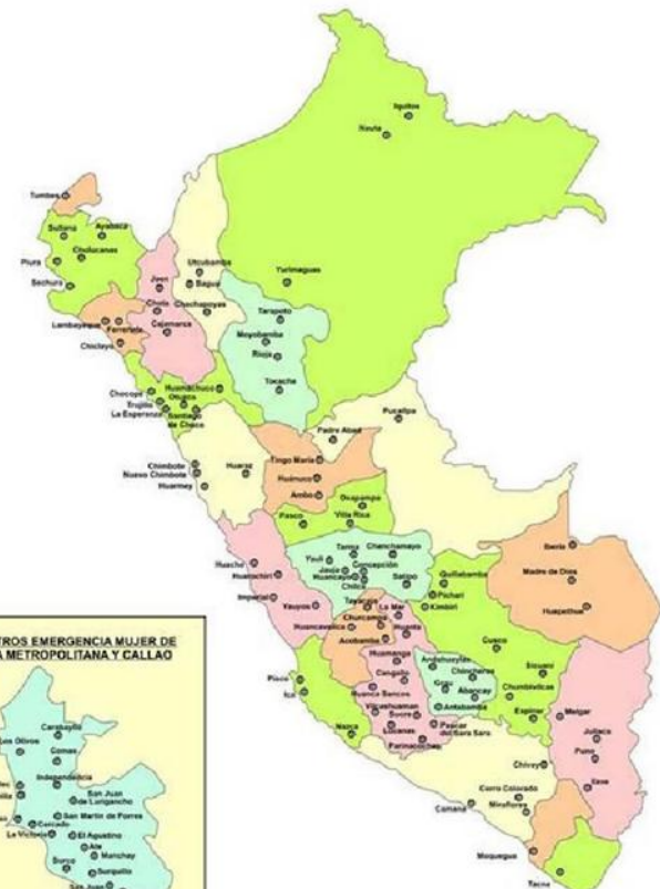
CENTROS EMERGENCIA MUJER A NIVEL NACIONAL

Para conocer la dirección del Centro Emergencia Mujer más cercano haga consulta llamando gratis a la Línea 100