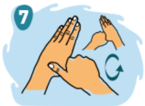
7 Frota los dedos rotándolos uno por uno