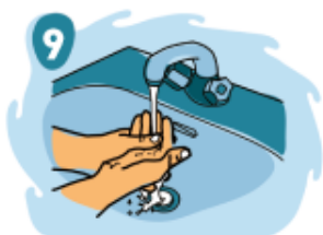
9 Enjuague las manos con abundante agua