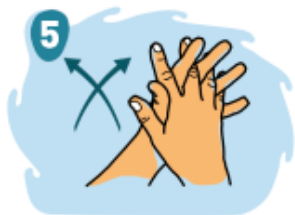
5 Frota palma con palma con los dedos entrelazados