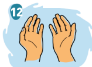
Manos limpias. Vidas saludables