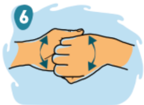
6 Empuña las manos y frota los dedos de arriba hacia abajo