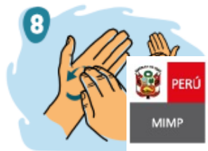
8 Frota la yema de los dedos repita el mismo ejercicio