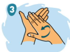
3 Frota sus manos con la palma