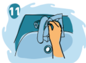
11 Utilice la toalla para cerrar el grifo