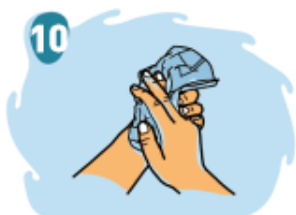
10 Seca bien tus manos