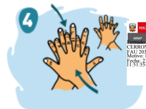
4 Frota la palma sobre el dorso de la mano