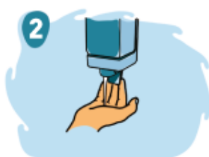
2 Aplique jabón sobre sus manos húmedas