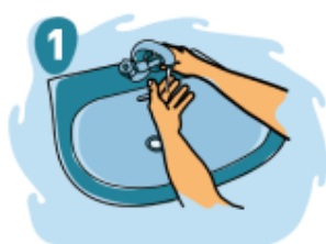
1 Humedezca sus manos con abundante agua