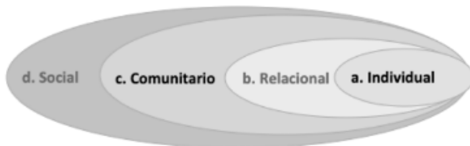
Ilustración 1: Modelo conceptual de la violencia contra la mujer